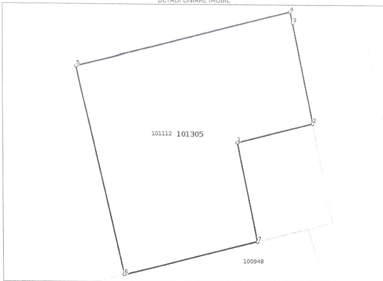
DETALII LINIARE IMOBIL

* Suprafața este determinată în planul de proiecție Stereo 70.